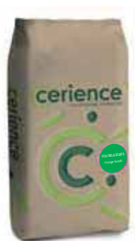
Conditionnement : Sac de 15 kg